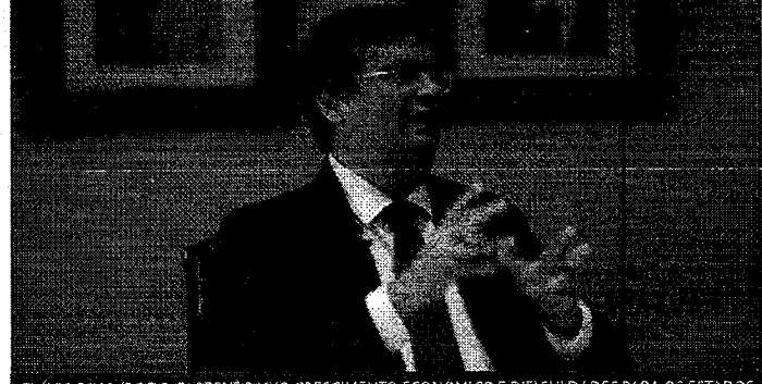
FLÁVIO DINO (PC DO B) PREVÊ BAIXO CRESCIMENTO ECONÔMICO E DIFICULDADES PARA OS ESTADOS

FD-Nosso desejo é que a relação com o novo governo se dê normalmente como aconteceu com Michel Temer. Foi oposição a Temer, mas tivemos uma relação institucional absolutamente normal. Eu não vou renunciar a nenhuma das minhas posições e o presidente não vai renunciar às dele. Mas espero que tenhamos uma relação em termos respeitosos e não em uma lógica de confrontos eternos.